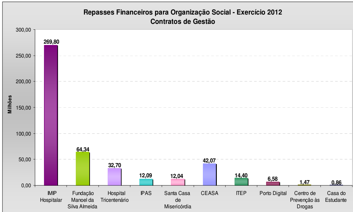
Gráfico 2 - Repasses financeiros para OS's - Exercício 2012: contratos de gestão – valores em R$