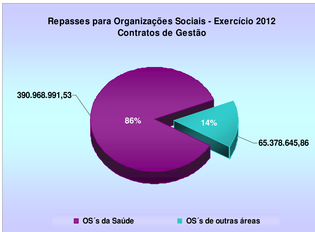
Gráfico 1 – Repasses para OS's - Exercício de 2012: Contratos de Gestão - em R$

Do total repassado às OS's em 2012, R$ 390,97 milhões foram destinados às Organizações Sociais da área de saúde 7 , corresponde a 86% do total dos repasses nesse exercício (R$ 456,35 milhões), conforme ilustra o gráfico a seguir.